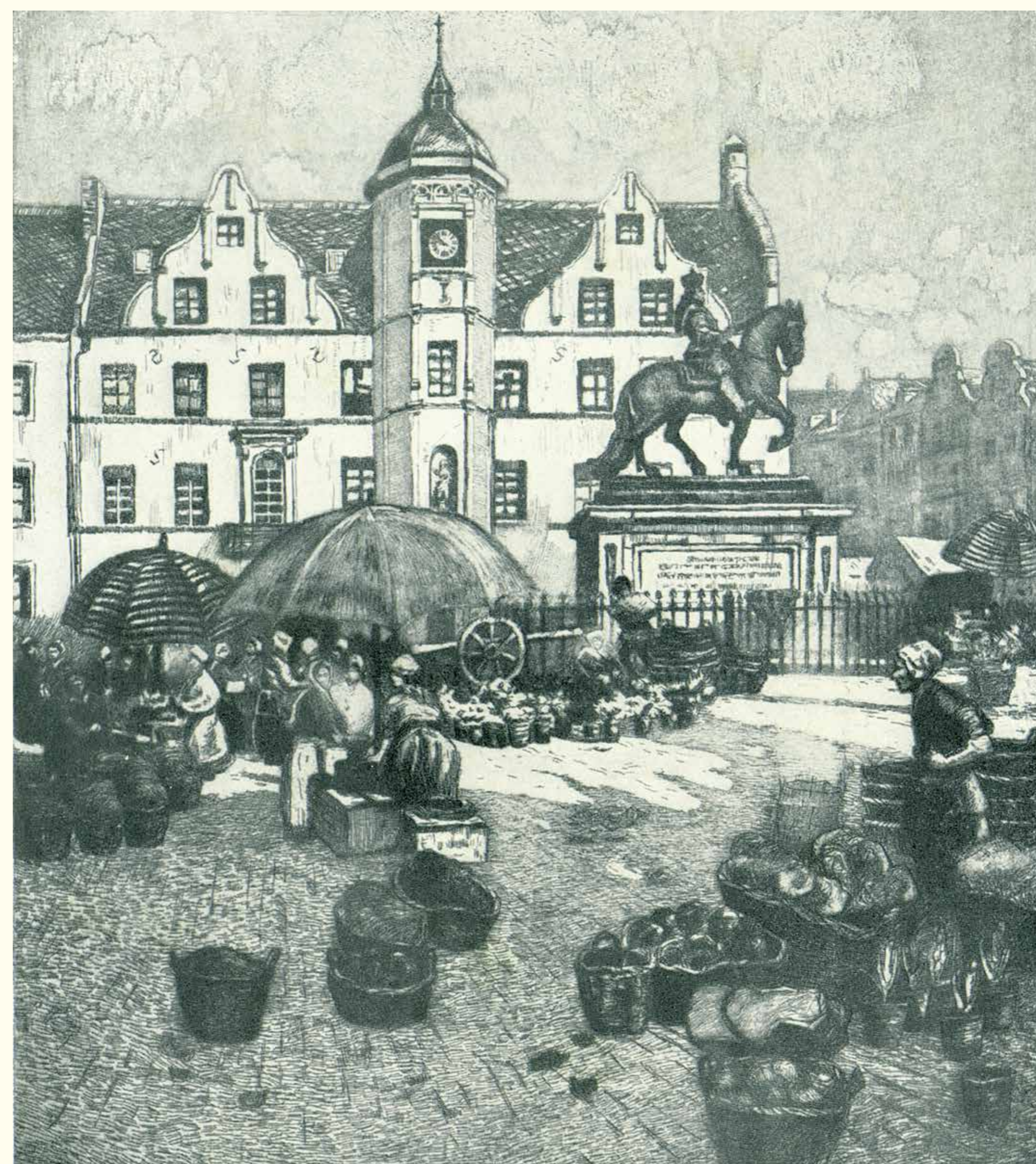
Der Markt in Düsseldorf Radierung von August Kaul

In »Rheinische Erzähler«, Agenda 1914, Leonhard Tietz, Akt.-Ges., Düsseldorf