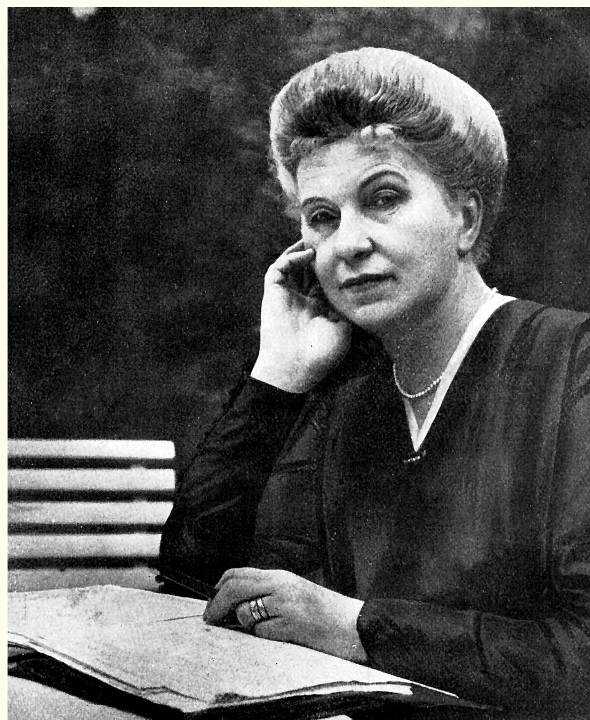
Aufgenommen um 1920

Aus Uhu. Das Ullstein Magazin, Berlin 1925.