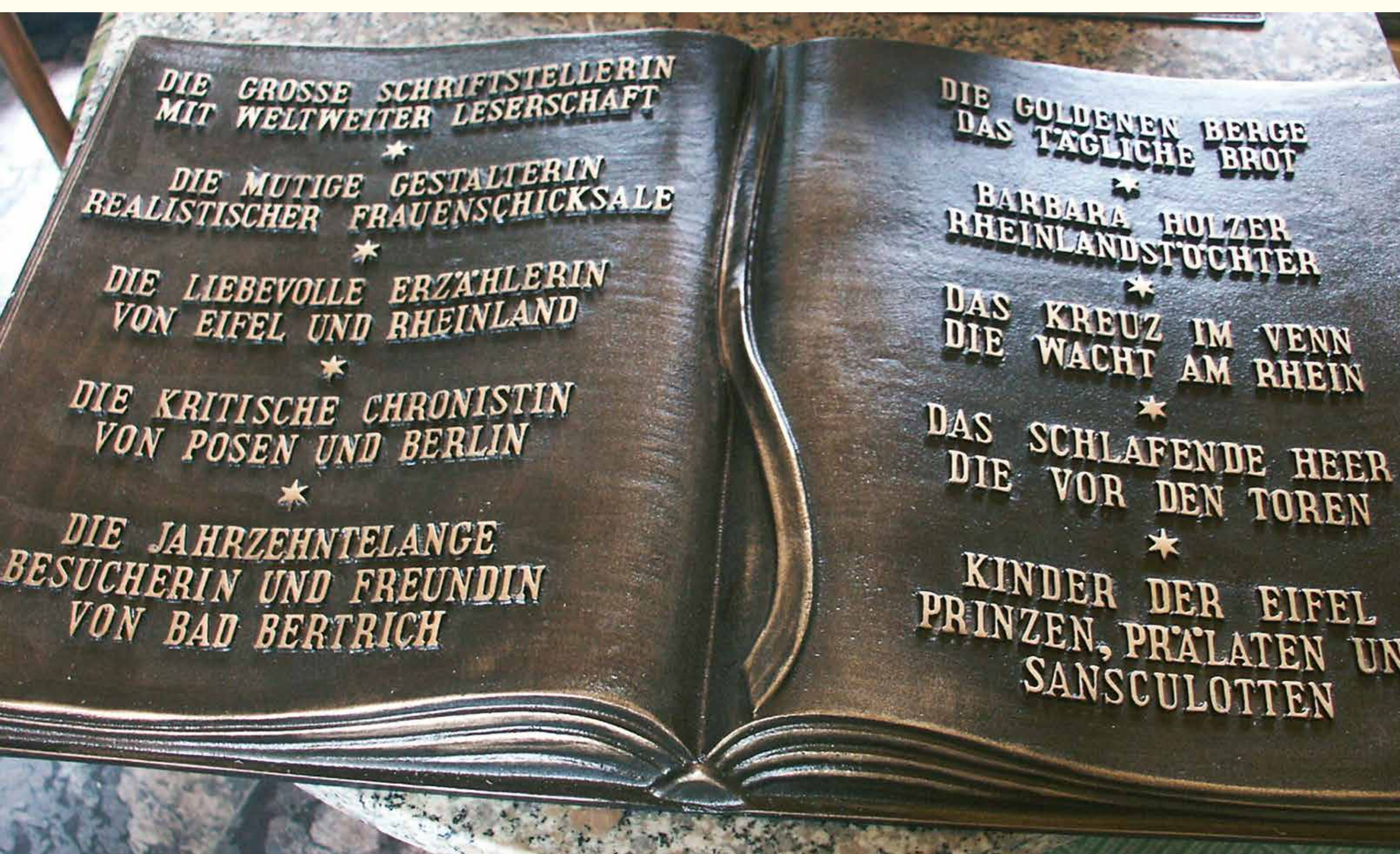
Teil des Clara-Viebig-Denkmal in Bad Bertrich